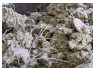
Wapening in de gehele doorsnede

kunt u krijgen bij de Mebin-centrale bij u in de buurt (zie www.mebin.nl ). Wij maken graag een afspraak met u om de voordelen van Streetcrete® voor uw project verder uit te werken.